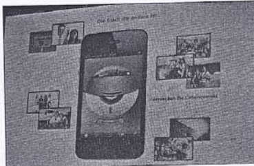
So könnte sie aussehen, die neue mobile Viernheim App.