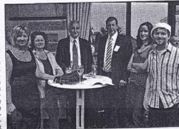
Die Arbeitsgruppe „Mein Unternehmen, das unbekannte Wesen“.

nomie und Service, Handwerk und kaufmännische Berufe. Diese Veranstaltung, bei der es zu öffentlichen sehr guten und produktiven Gesprächen kommen wird, können sich Unternehmer und Jugendliche miteinander austauschen. Es besteht die Möglichkeit zu Bewerbungsgesprächen und es gibt verschiedene Infostände, die sicher auf reges Interesse stoßen werden.